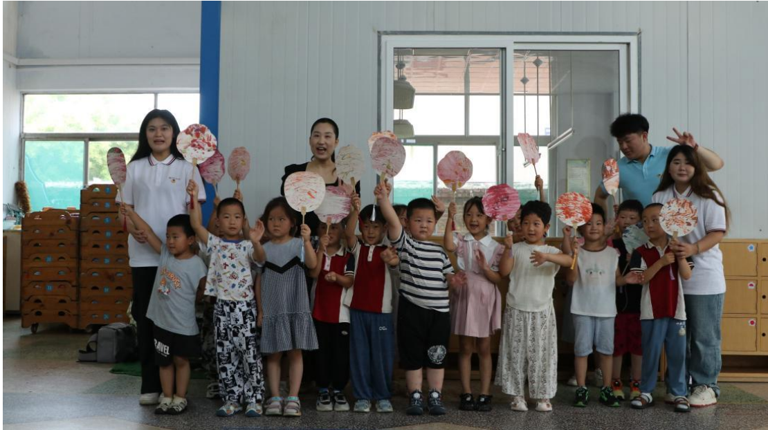
师生带领幼儿园孩子体验非遗漆扇技艺

精髓，以及新型工具在剪纸艺术中的创新应用，并指导学生们亲身实践剪纸艺术，让同学们近距离感受到了中华优秀传统文化的魅力。