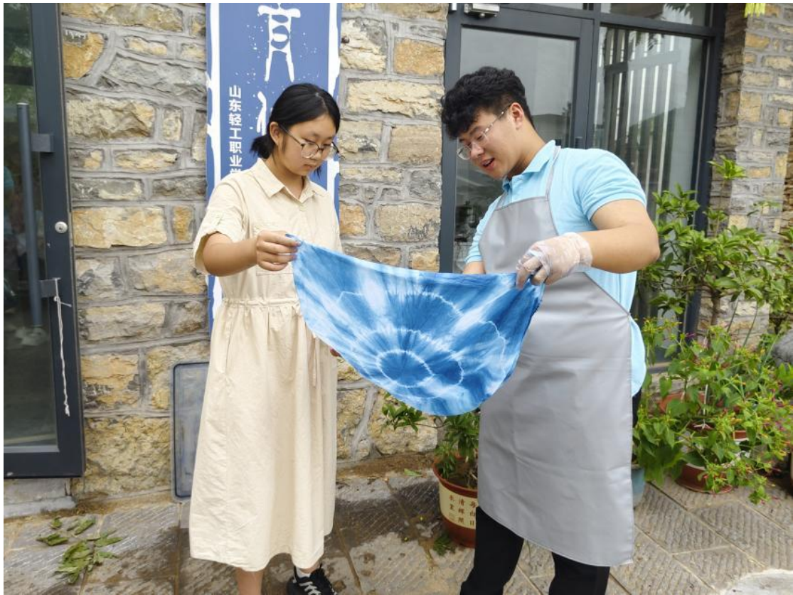
草木染走进淄川区太河镇东东峪村

（二）浸润幼儿园及中小学美育课堂。师生走进淄博六中，以“数智时代的非遗传承——新剪纸技艺”为题开展主题讲座，详细解读了艺术创作的基本原理、传统剪纸技艺的