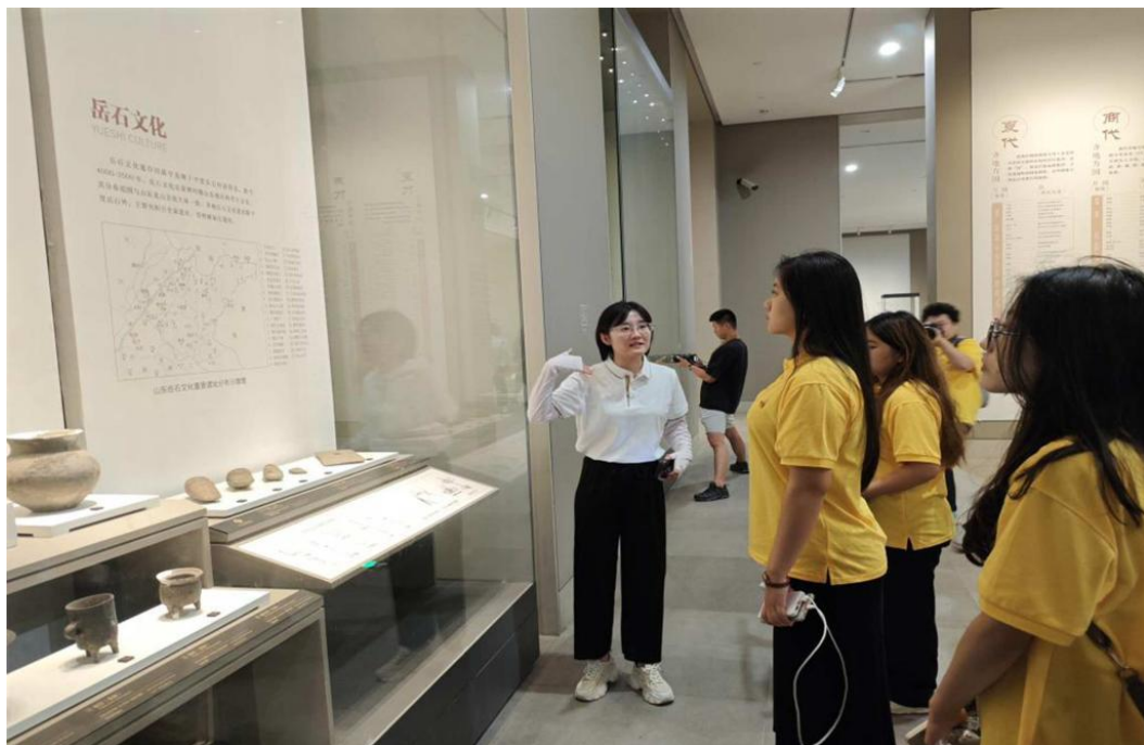
教师带领学生参观临淄齐文化博物馆