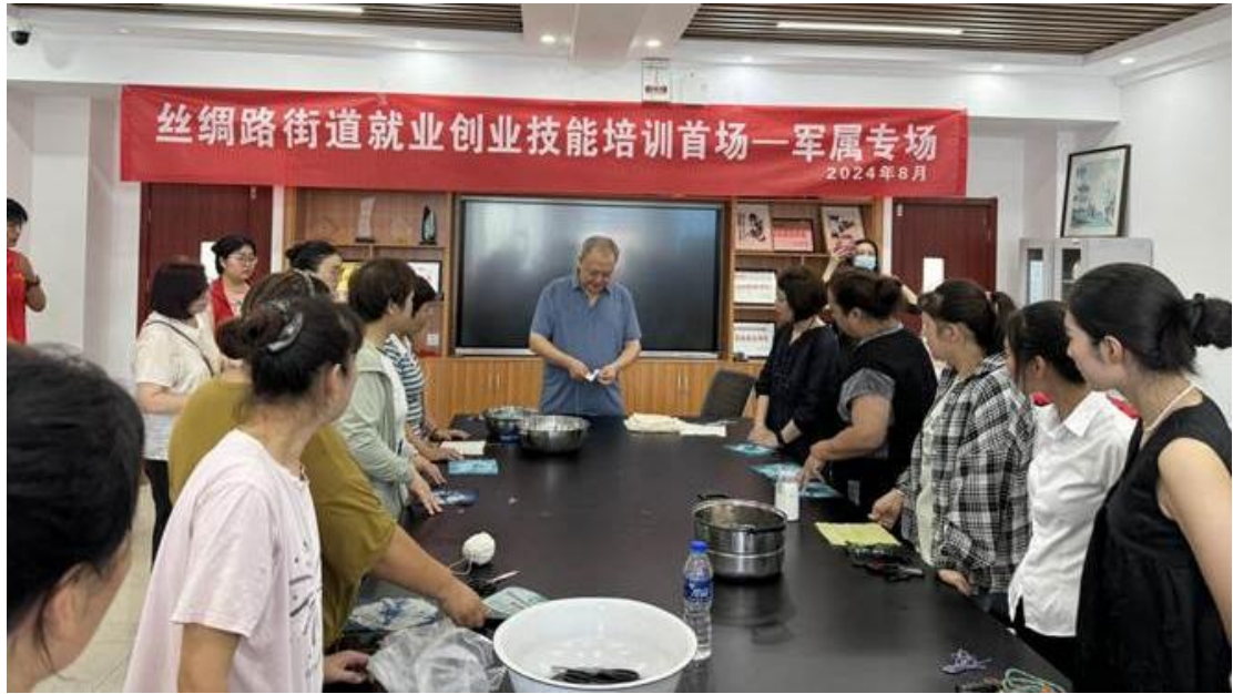
师生走进丝绸路街道开展手工扎染技艺培训