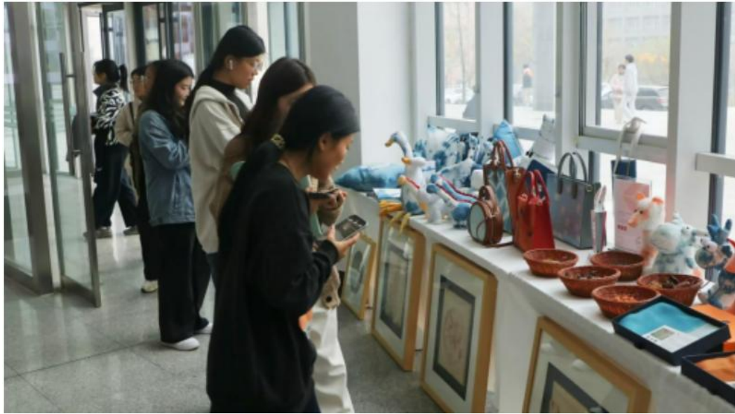
学生参观校内非遗成果展

有更深刻的认识和了解，同时，定期在校内艺术展厅开展丰富的艺术作品展，提高学生参与的积极性。另一方面，充分借助区位优势，不定期组织学生到周村古商城、陶瓷琉璃馆、齐文化博物馆等校外美育基地，感受周村丝绸文化、商埠文化和淄博的齐文化和陶瓷文化，开展艺术馆打卡活动十余次。