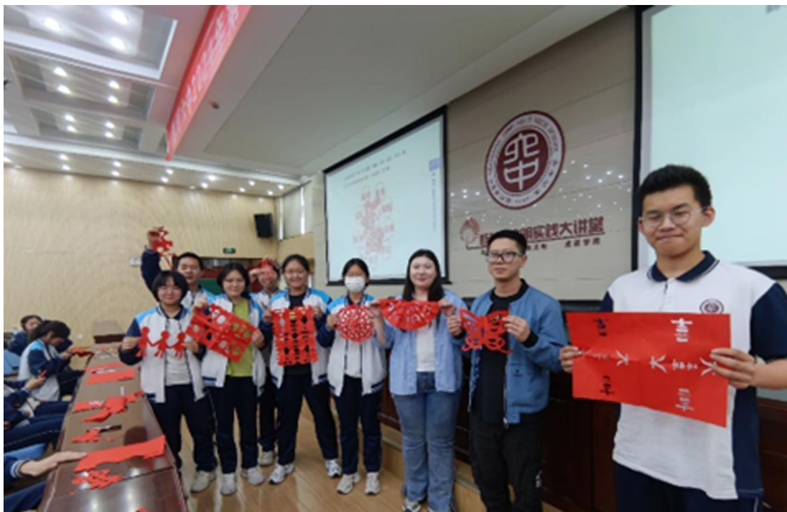
淄博六中学生展示现场制作的剪纸作品