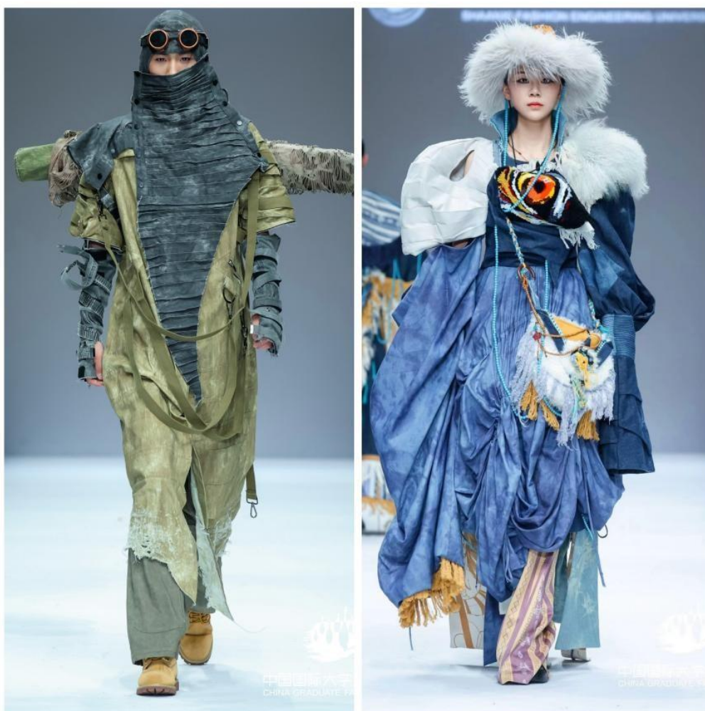
我校学生登上2024中国国际大学生时装周的舞台

(二) 特色项目登上国际舞台。2024年3月8日，我校学生参加了在中国澳门举行K·SWISS 时装品牌全球发布会。5月、9月，我校学生登上2024中国国际大学生时装周和SS25中国国际时装周的舞台。10月30日，我校学生参与主创的动画作品《辉腾梁传说》斩获韩国釜山国际艺术节数字媒体动画类金奖。