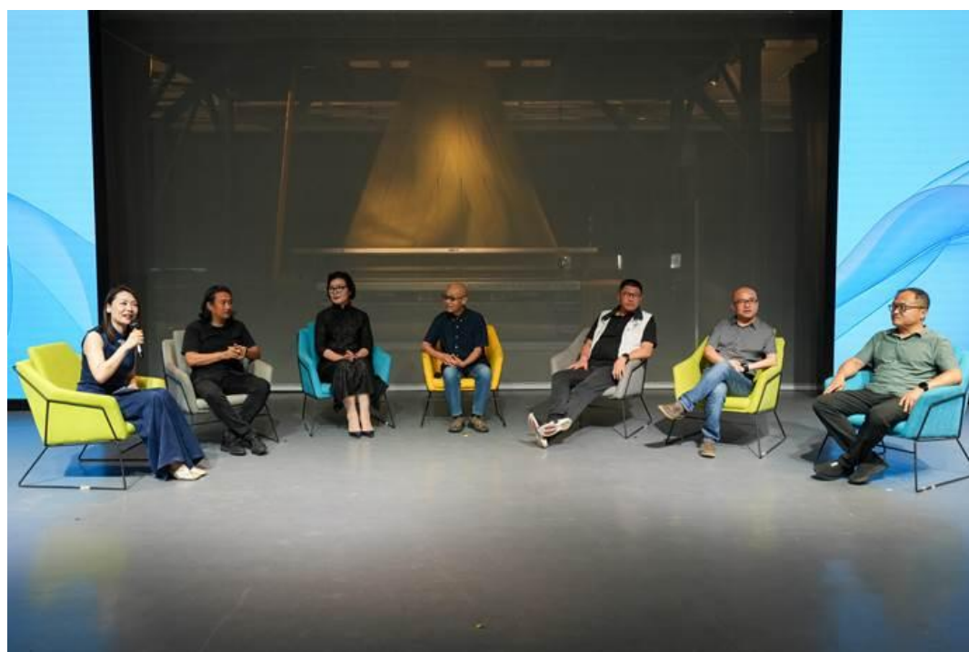
“时尚引领潮流”高峰论坛

(四) 多类场馆促进美育体验。一方面充分利用校园美育环境与资源，引导学生参观学校特色建筑 1960 丝绸文化中心、“三转一响”博物馆和校史馆，让学生们对学校文化