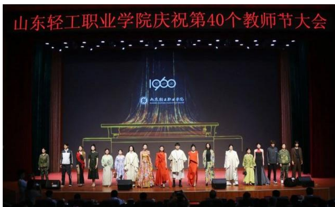
庆祝教师节表演活动

（五）扎实推进美育实践。既有学校层面的校园文化艺术节沿袭多年，也有艺术作品展、模特大赛、校园摄影大赛等广受欢迎、自由灵活的日常活动。同时，霓裳羽衣汉服社、国标舞社团、齐颍社团等十余个艺术社团，组织了一系列艺术实践活动，激发了学生的艺术主体意识和创新意识，丰富了学生的艺术体验和美育感悟。