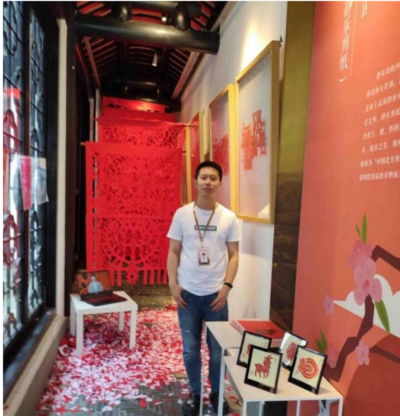
我校教师参加山西忻州文化遗产精品展示月系列活动